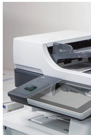
การเข้าถึงเครื่องถ่ายเอกสาร