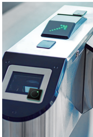
ประตูดาวน์โหลด