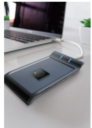
การล็อกอินเข้าสู่คอมพิวเตอร์