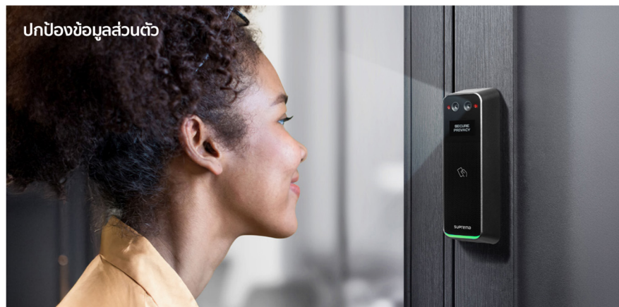
ปกป้องข้อมูลส่วนตัว